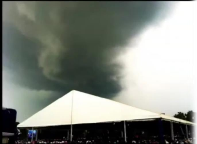
THE THICK DARK CLOUD OF GOD DESCENDS - DECEMBER 22, 2019