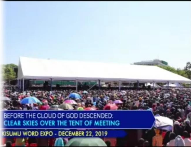
BEFORE THE CLOUD OF GOD DESCENDED: CLEAR SKIES OVER THE TENT OF MEETING KISUMU WORD EXPO - DECEMBER 22, 2019