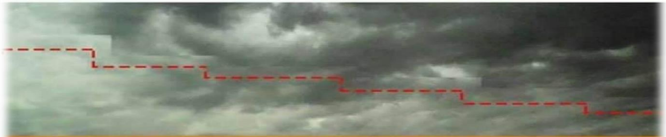
THE GLORIOUS STAIRS TO HEAVEN CAUGHT ON CAMERA IN THE MEGA NAKURU SUNDAY SERVICE - 11 MARCH 2018